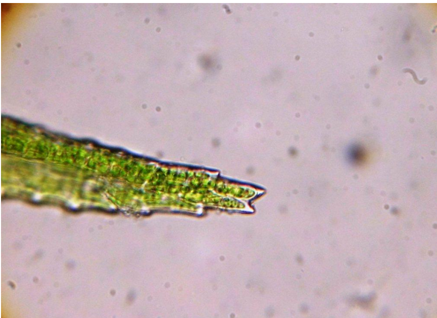
Bladtop van het boskronkelsteeltje