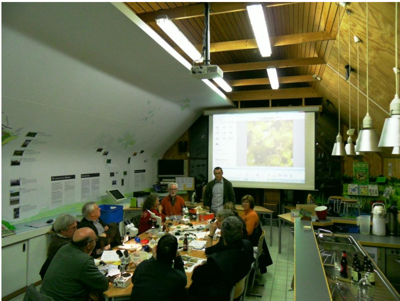
De grote middelen werden ingezet